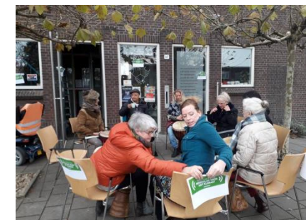
Buitenwacht luidt noodklok klimaat