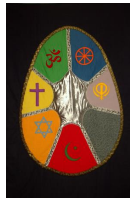
Alle geloofsopvattingen zijn welkom