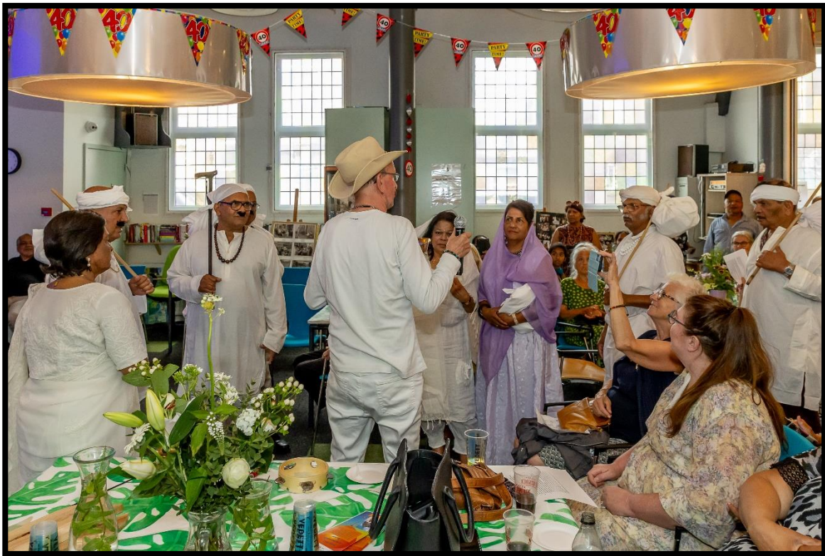
150 jarig bestaan hindoestaanse immigratie